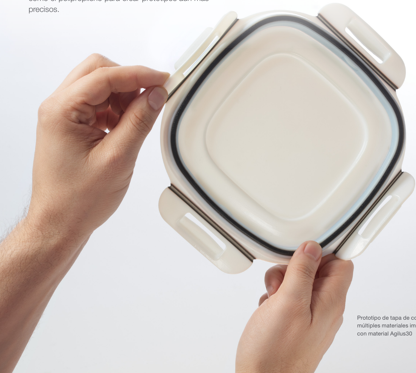
Prototipo de tapa de contenedor de múltiples materiales impreso en 3D con material Agilus30

Y si lo que necesita es imprimir a todo color en fases posteriores de la línea de producción, puede actualizar la J850 Pro para satisfacer esas necesidades.