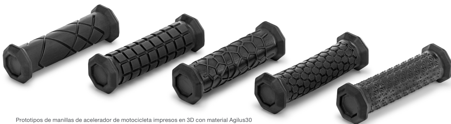
Prototipos de manillas de acelerador de motocicleta impresos en 3D con material Agilus30

Con la J850 Pro, resulta sencillo crear modelos funcionales con múltiples materiales que permiten probar y validar los prototipos más rápido y superar fácilmente la etapa de revisión. El resultado son decisiones y aprobaciones más rápidas, que facilitan la verificación de los productos, aumentan el rendimiento y ahorran un tiempo valioso.