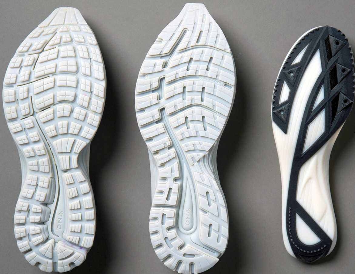
Prototipos de media suela y suela de zapato impresos en 3D creados con Brooks Running