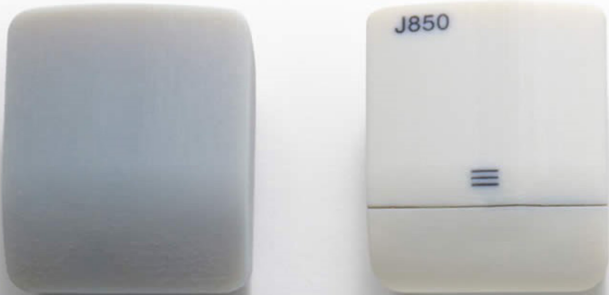
Prototipos de estuche de auriculares impresos en 3D con DraftGrey (izquierda) y VeroPureWhite (derecha)