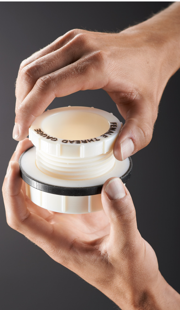
Prototipo de calibre para roscas con componentes macho y hembra

Utilice la familia de materiales Agilus30™ para crear piezas y prototipos flexibles que pueden flexionarse, doblarse, alargarse y sellarse.