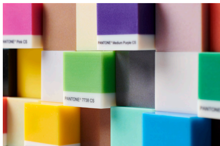
Bloques de color Pantone