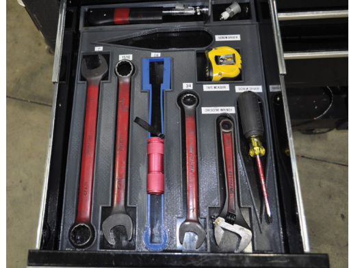
La liberté de conception qu'offre la fabrication additive vous permet de créer facilement des porte-outils et des plateaux de calage personnalisés.

La liberté de conception qu'offre la fabrication additive vous permet de créer facilement des porte-outils et des plateaux de calage dont la forme épouse les outils et pièces qu'ils contiennent. Et ce, quelle que soit la complexité des formes, car la fabrication additive n'est pas assujettie aux contraintes habituelles de l'usinage soustractif.