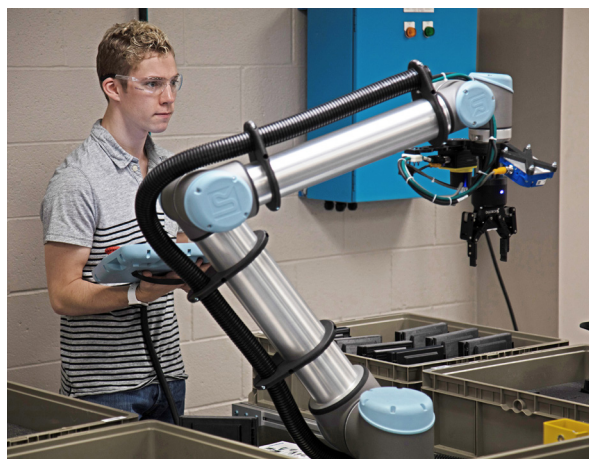
Les effecteurs imprimés en 3D, plus légers, réduisent la charge sur les bras robotiques, et leur fabrication est généralement plus rapide et moins coûteuse que celle de leurs homologues métalliques.