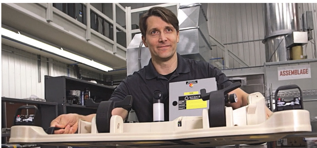
L'impression 3D de ce gabarit de joint de porte automobile a permis de réduire le poids de 80 % et la durée du cycle de la tâche.

Cet aspect n'est pas à ignorer. Aux États-Unis, la Occupational Safety and Health Administration estime que les accidents du travail coûtent aux employeurs près d'un milliard de dollars par semaine au titre d'indemnités directes au personnel. 1 Les lésions attribuables au travail répétitif se développent avec le temps, et ont un impact progressif sur votre personnel, réduisant leur efficacité et leur productivité, jusqu'à ce que des soins s'imposent. L'emploi d'outils imprimés en 3D, plus légers et plus ergonomiques, peut contribuer à atténuer ou éliminer les arrêts de travail provoqués par ce type de tâche répétitive, réduisant ainsi l'impact sur la production et la santé de votre personnel.