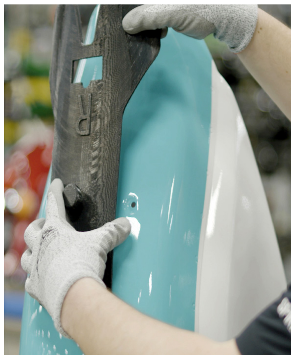
Un outil de montage souple et lisse en élastomère TPU 92A permet de positionner le badge sur le réservoir de la moto sans endommager la surface peinte.

Il y aura toujours des applications qui ne pourront pas se passer de métal, mais un grand nombre, pour ne pas dire la plupart des gabarits, fixations et accessoires de montage peuvent être imprimés en 3D avec des thermoplastiques FDM.