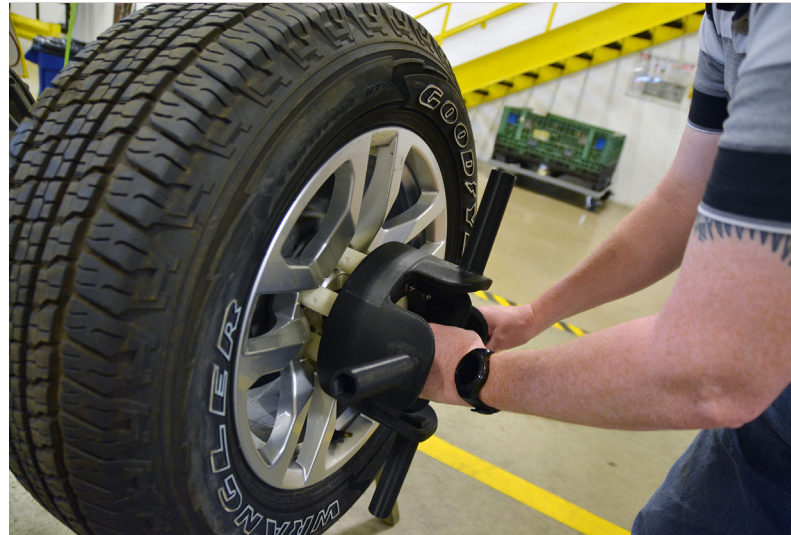
Cet outil de montage imprimé en 3D constitue un moyen plus léger et plus rapide d'installer des boulons de roue.

En ce qui concerne la conception, l'impression 3D vous permet de réaliser des itérations de votre outil de façon beaucoup plus efficace. Vous imprimez l'outil, vous le testez, et si des modifications sont nécessaires, il vous suffit de changer la conception CAO et de relancer une impression. Cela vous permet d'optimiser la conception de votre outil. Dans la plupart des cas, un tel résultat serait impossible avec des outils usinés, en raison des délais et des coûts associés.