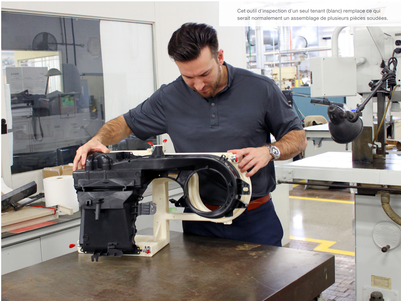
Cet outil d'inspection d'un seul tenant (blanc) remplace ce qui serait normalement un assemblage de plusieurs pièces soudées.

La combinaison de ces avantages en matière de coût, de rapidité et de qualité de conception permet de créer et de déployer un plus grand nombre d'outils au cours du processus de production. Et une fabrication plus rapide se traduit par une réduction du temps nécessaire à l'outillage d'une nouvelle ligne de production. Des outils rendant les tâches plus efficaces, plus précises, mais dont la justification était auparavant impensable pour des raisons de délais et de coûts, sont désormais réalisables. Grâce à une simplification des tâches, les nouveaux outils améliorent l'efficacité des processus. L'augmentation du nombre d'outils d'ajustement sur une chaîne de montage garantit une détection et une correction précoces de la moindre perte de qualité. Et l'effet cumulatif de la réduction des coûts et de l'amélioration de l'efficacité se répercute sur l'ensemble du processus de production.