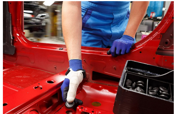
Cet outil blanc conçu pour le pouce, imprimé en 3D, assure un effet de levier et réduit la fatigue, ce qui évite les blessures provoquées par la tâche répétitive d'insertion de ces bouchons en plastique.