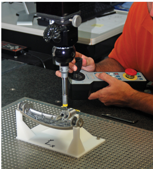
Ce gabarit d'inspection CMM a été créé en une fraction du temps nécessaire à la fabrication d'un outillage métallique.