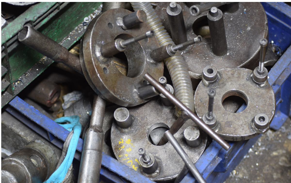
Les outils imprimés en 3D peuvent remplacer des gabarits de montage métalliques multi-pièces soudés comme celui-ci.

Ce modèle d'outillage a été la norme, et continue de l'être, dans la plupart des processus de fabrication. Or, il présente un inconvénient majeur, à savoir qu'il limite la capacité d'un fabricant à améliorer ses processus : un véritable paradoxe, puisque la raison d'être d'un outil est de simplifier la production. Un rôle qui n'est cependant plus rempli lorsque les coûts sont trop élevés, la justification devient difficile et la possibilité de changer la situation actuelle trop limitée. La plupart des entreprises se contentent de faire avec, et assument que cet état de fait est tout simplement le tribut à payer pour exercer leurs activités.