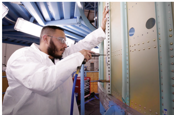
Des gabarits de perçage simples à fabriquer accélèrent le processus de montage de ce lanceur spatial.

Les outillages robotiques (EOAT) sont l'exemple parfait de l'obsolescence des outils conventionnels par rapport à la fabrication additive en matière de résistance, légèreté et liberté de conception. Les EOAT étant plus légers, il est possible de réduire la taille des moteurs d'actionneurs de robots ou d'augmenter la vitesse d'actionnement de leurs bras. Les EOAT imprimés en 3D permettent par ailleurs de privilégier les conceptions multipièces et d'incorporer des canaux de vide internes, entre autres fonctionnalités intégrées.